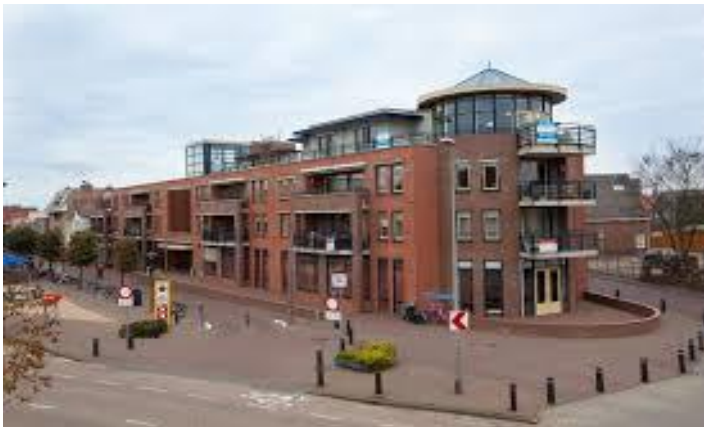
Trefpunt – Vergaderlocatie – Noordwijk/Zee