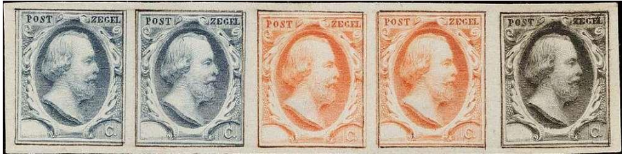
Stempel proef op proefpapier postzegels - Nederland

Willem Alexander Paul Lodewijk (Brussel, 19 februari 1817 – Apeldoorn, 23 november 1890).